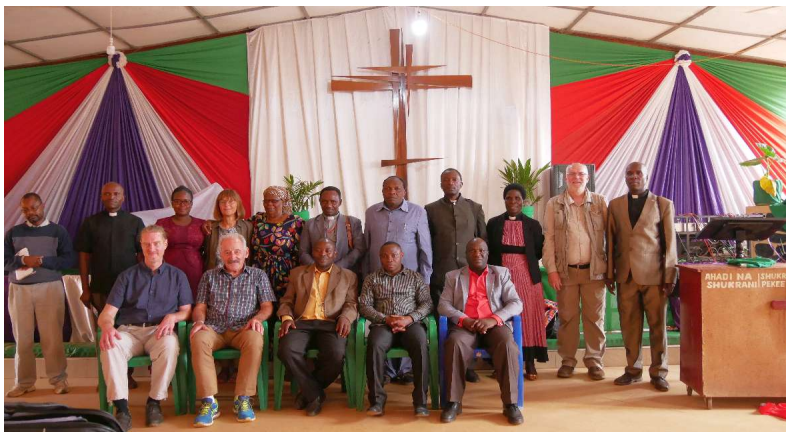
Treffen mit dem Partnerschaftskomitee